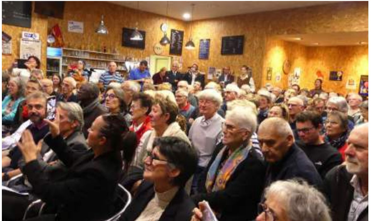
■ Plus de 150 personnes assistent aux « cafés normands », soirées culturelles où la langue normande est mise à l'honneur sous toutes ses formes

Le public se plaît à réentendre parler normand comme leurs parents et arrière-grands-parents. Les films et les photos présentés montrent l'activité agricole dans les champs et le travail du cheval avant l'apparition du tracteur. Ils provoquent certainement un peu de nostalgie face à la rapidité du progrès. Tous ces ingrédients constituent peut-être le « secret » de la réussite ?