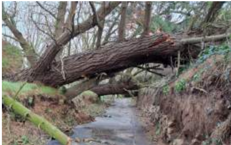
■ D's arbres, victaemes d'la Tourmente Goretti

Oy-ous, tchi qu'est d'chu naom Goretti? Ch'est qu'il est dit qué ch'tait l'Météo-France qui lé chouaïssit èrit qu'il tâmpètrait tant par la France. I r'sembble qué chu naom viant d'la Santa Maria Goretti: vierge, martyre Italiannne dé tchi l'Éghise Catolique creit d'tché grâce à sa purtaie et son pardaon, et ch'est qu'alle l'associe étout daouve la fé et lé sauegard. I s'peut qu'l'naom Goretti entende 'ête en giaette' – ch'est pour tchi la Santa Maria érait naom: 'La Ptite qu'est en Giaette'. Enfin, nou n'peut pas saver s'a giettaït par dessus naon la gniettie du 8 au 9 du meis d'Janvier, et si l'affaire srait bian pière sans son sauegard, mais i'y a ènne affaire qu'nou sache: ch'est qu'l's ormes vâlent raide et qu'i prennent ènne partie d'la forche dé toutes tourmentes! Ch'est pourtchi qu'nou devrait en faire grand cas d's arbres, et les souognier coume i faout pour si en cas.