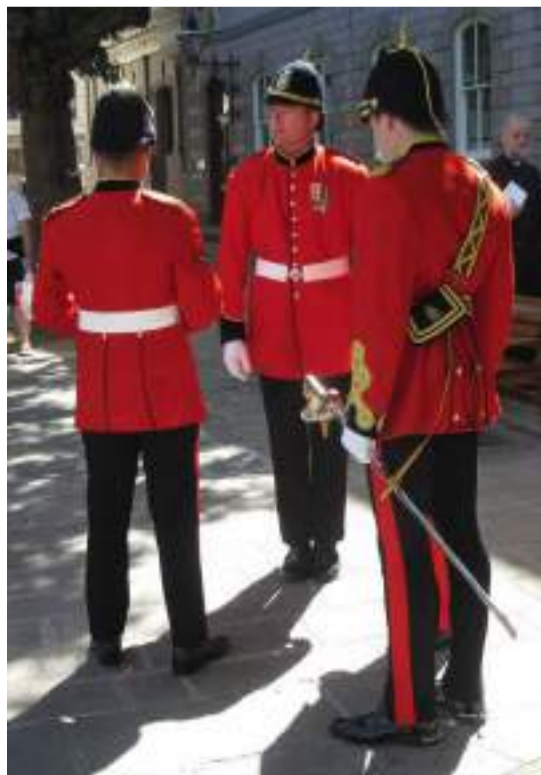
■ Milice lors des célébrations du 80ème anniversaire de la Libération de Jersey

Mais ch'est-i' d'èrpenser nos d'fenses dans l'monde d'au jour d'aniet?