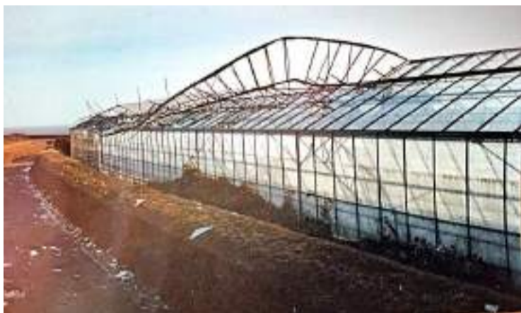
■ Aen spâne bûchi et teurt du vent en 1987

L's autoritaies nous giernissirent, et durant la gniettie du 8 au 9 du meis d'Janvier, lé Baïlliage à Guernesï souffrirait la fâmaeuse forche d'la Tourmente Goretti. Bian du maonde sé r'mettrait d'la grand tourmente dé dix-neu chent huitante saept quand i'y eut tant d'spânes, et d's ormes perdus! Bian du maonde croïnrait lé tout pus gros! "La pllie et l'vent saont près parents", et ch'fut tant pus vrai chu caoup-chin tchaer, gâtérobotin, i ventait dur et i n'en tchéyait! La terre déjà en teur à caouse du mouoilli temps, vint en teur dé teur! Chu qui l'amollisait tant qu'les rachaenes ès arbres à bian des tacques s'en baillaient. Décaôte les tiles et d'rocas des bâtiments qui furent houlaïs partout par les câmps, ch'tait ènne véritâble tristaesse à veie aen bian gros lot d'arbres érachies et évauripaies