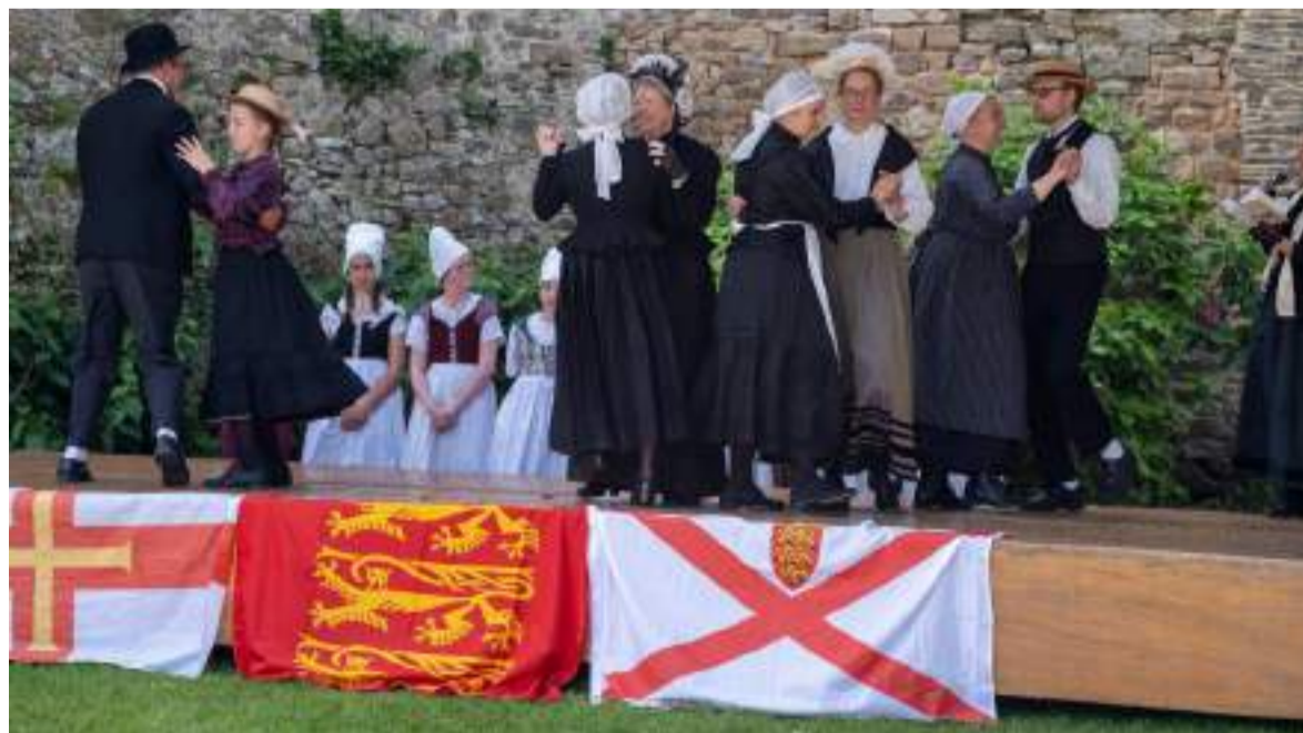
■ La Fête des Rouaisons, grand rendez-vous annuel de la culture et de la langue normande a eu lieu dans l'enceinte du château de Briquebec en 2025. La prochaine édition aura lieu à Jersey en juin 2026

Magène prépare une comédie musicale, un spectacle sur les Normands en Sicile, « Les aventuriers du soleil d'Italie ». Une comédie musicale ! Quelle aventure ! L'association Magène en a déjà réalisé une : « Les Oûées de Pirou », en 2006. Là, partant du Coutançais, nous suivrons deux femmes, Aelis et Goda, jusqu'en Sicile. Goda aime Hugues qui est au service du mercenaire normand Reinolf (Renouf)