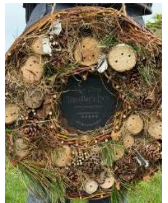
■ Les Adams Farm dans la paroisse de Saint Pierre du Bois à Guernesey est l'une des rares fermes de l'île qui ouvrent encore leurs portes aux petits écoliers

À travers ces visites, Les Adams Farm joue un rôle essentiel en maintenant le lien entre les jeunes générations et la terre. Dans un monde de plus en plus déconnecté de la nature, ces moments d'apprentissage, de découverte et d'émerveillement sont fondamentaux pour cultiver le respect de l'environnement et des ressources locales.