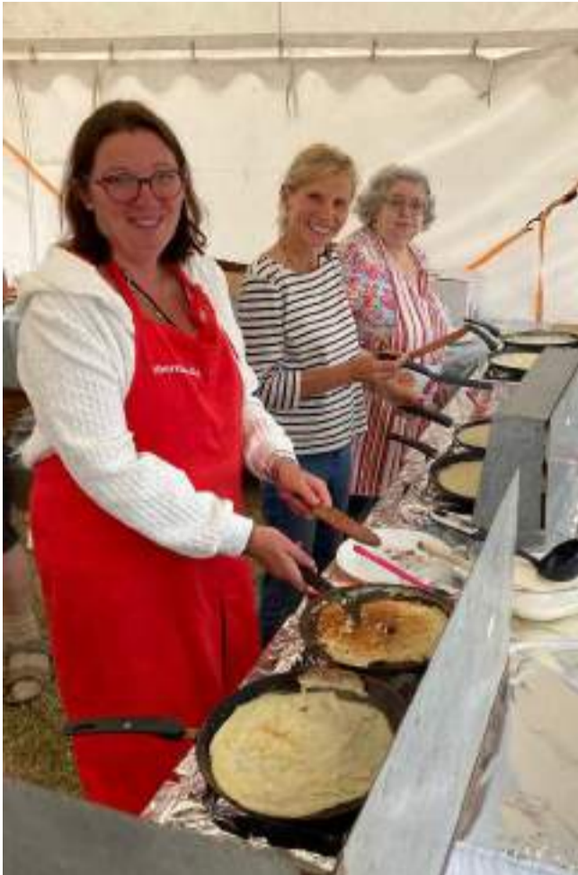
■ Les membres de l'Association de jumelage de Montebourg (commune manchoise jumelée avec la paroisse de Saint Sauveur à Guernesey) préparent de délicieuses crêpes normandes pour le plus grand bonheur des visiteurs du West Show de Guernesey