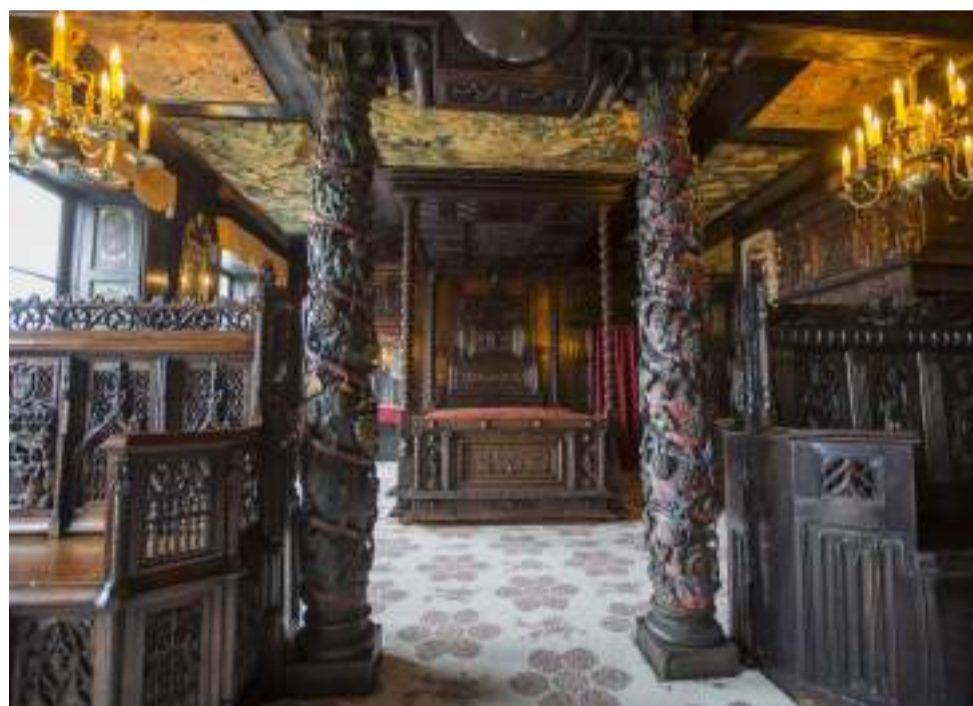
■ Vous pouvez désormais suivre Hauteville House sur Instagram et en découvrir un peu plus sur ce site exceptionnel ! @hautevillehouseguernesey

En 1942, il utilise tout de même son statut pour sauver un couple de Français vivant à Guerne-